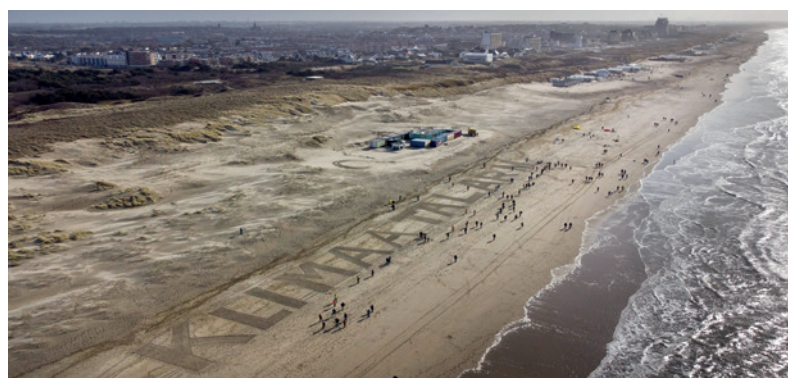
‘Klimaatproblematiek vereist lange termijnvisie’